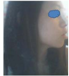
วันที่ 1 ค่ะ