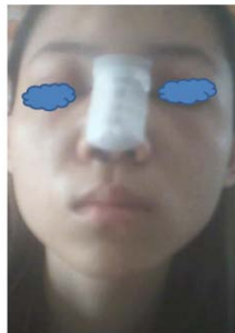
วันที่ 2 ค่ะ