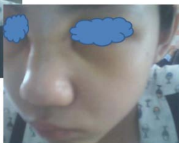
วันที่ 4 ค่ะ