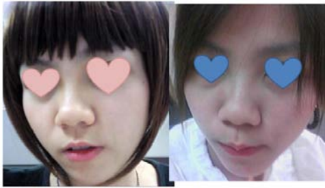
ก่อนทำ ค่ะ